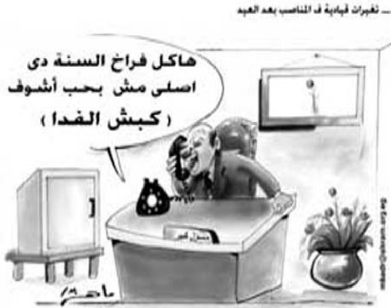
ماهر بدر - مصر Maher Badr - Egypt