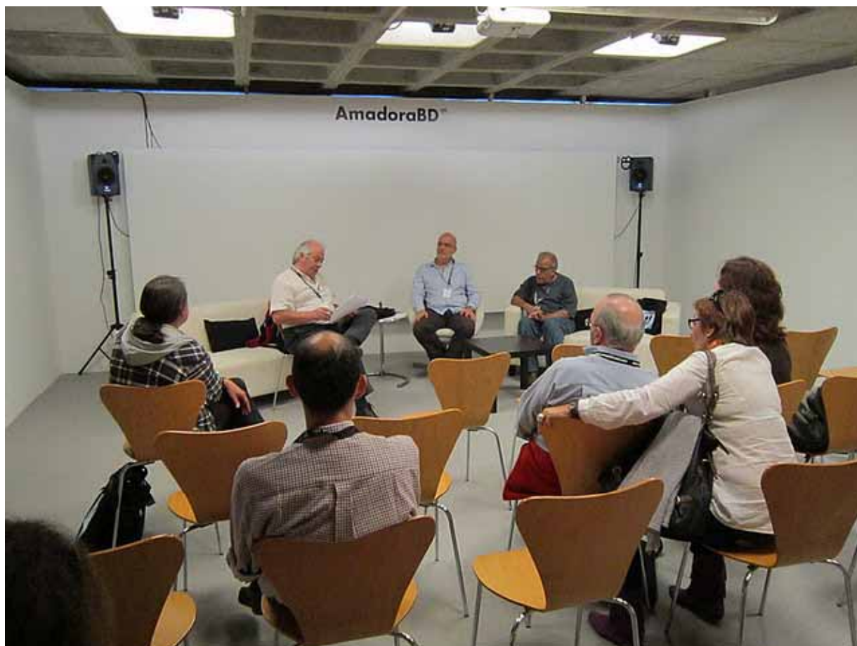
During a television program about the festival