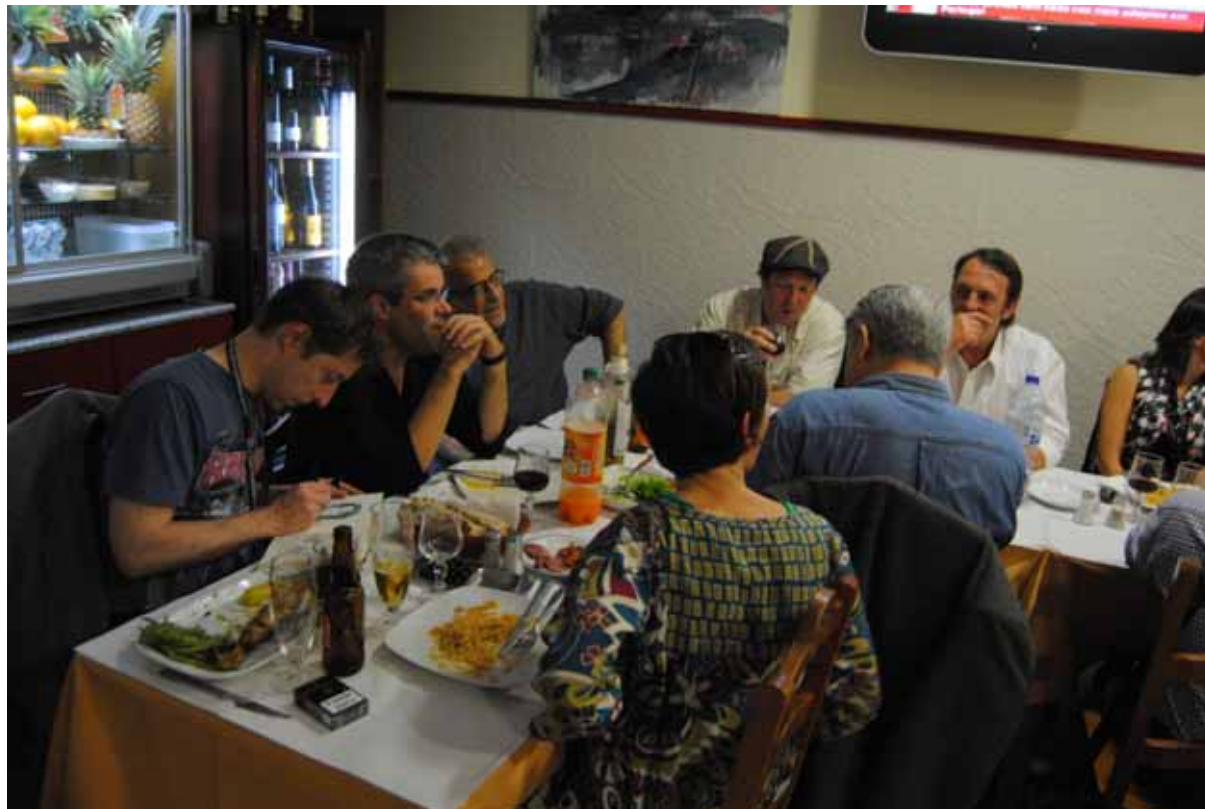
Discuss the work during the food