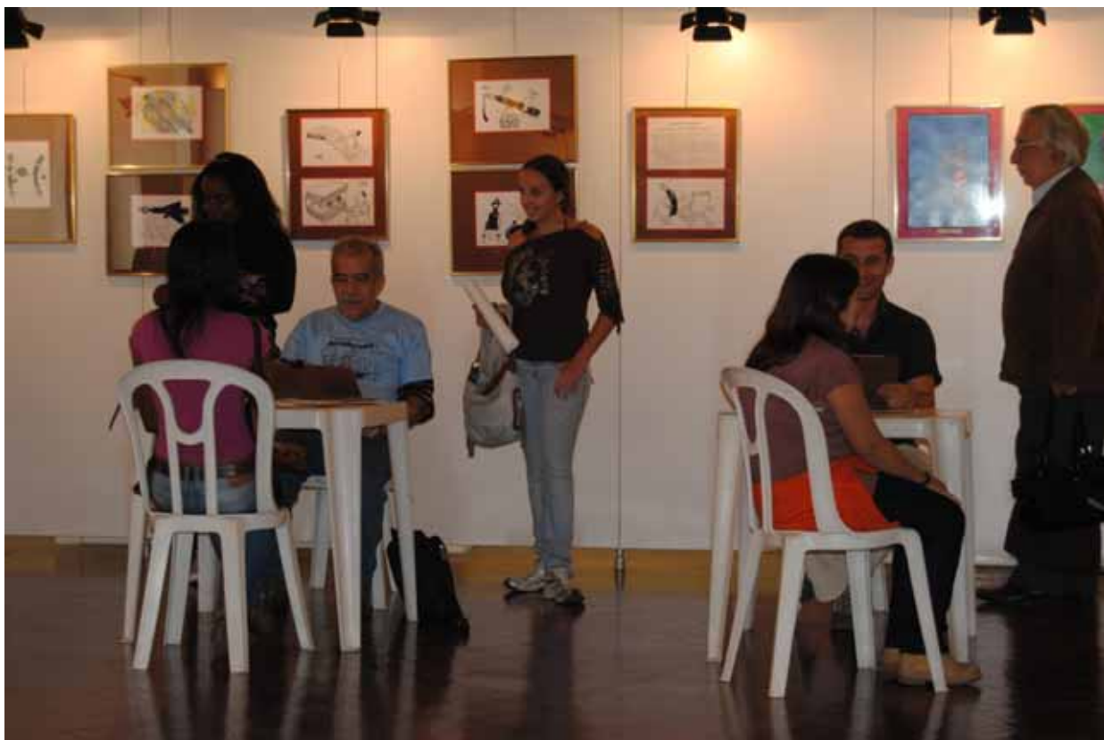
Effat in Amador Festival in Portugal